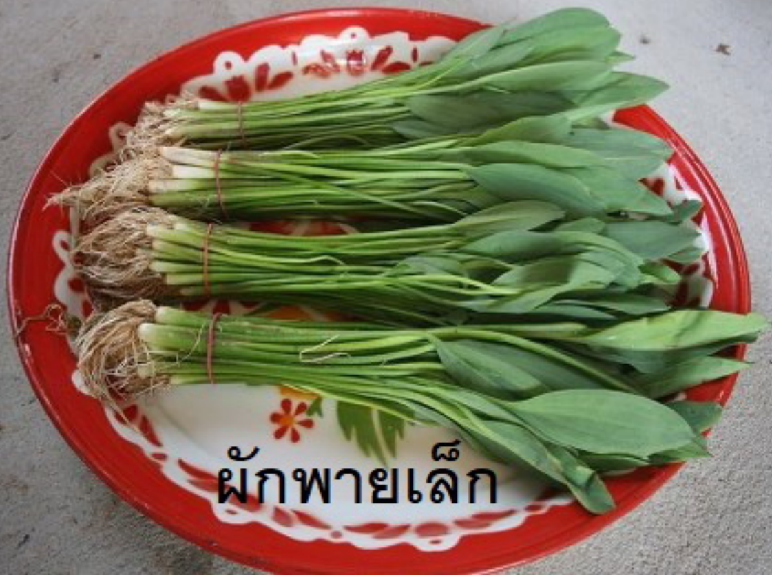
ผักพวยเล็ก