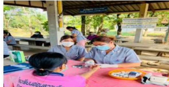
เจาะน้ำตาลปลายนิ้ว / ชั่งน้ำหนัก