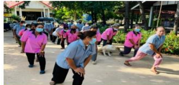
ออกกำลังกาย