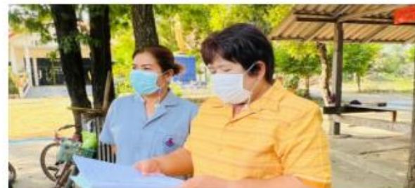
เช็คชื่อเข้าชั้นเรียน