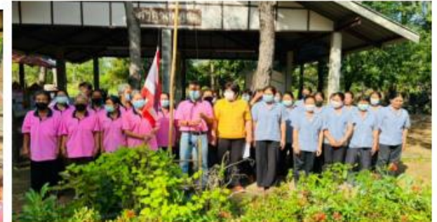
เคารพธงชาติ/สวดมนต์