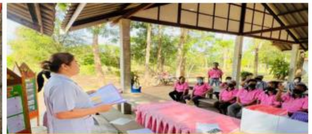
พบปะพูดคุย